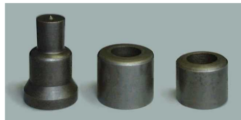
ポンチ ダイス43径 ダイス38径