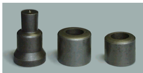
ポンチ ダイス43径 ダイス38径